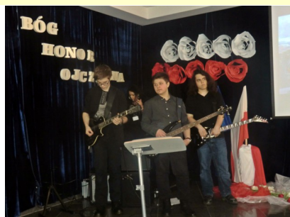
Akademia 3 Maja