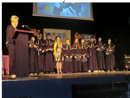
Zakończenie Roku Szkolnego