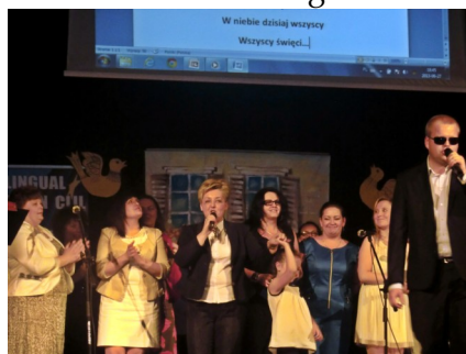
Zakończenie Roku Szkolnego