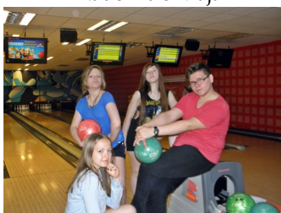
Wyjście na kręgle