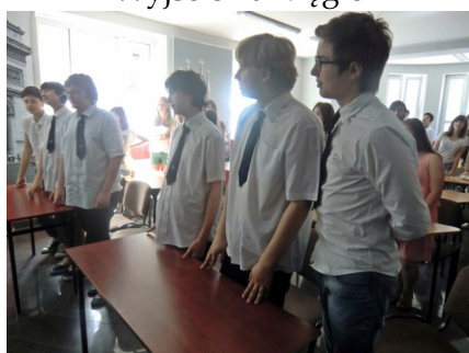
Warsztaty z native