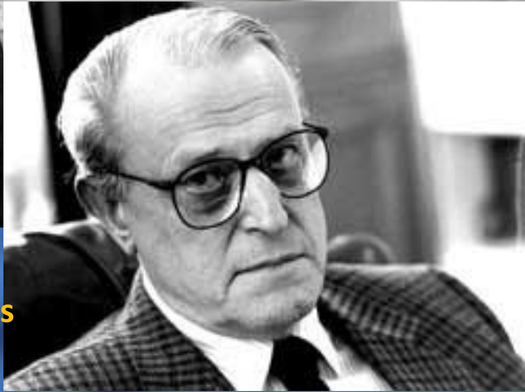
Willem Frederik Hermans